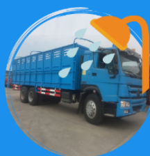
Rinsing containers or cargo areas of trucks