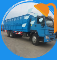
Requisitos de lavado