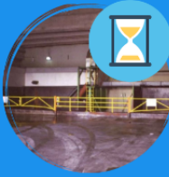
Limitando el tiempo de retención de materiales