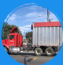
Covering truck cargo beds

Rendering facilities are required to take steps to reduce odors such as: