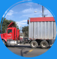
Cubrir los camiones

Las plantas de reciclaje de residuos animales estan requeridas a tomar medidas para reducir los olores, tales como: