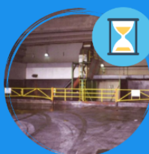
Limiting material holding times